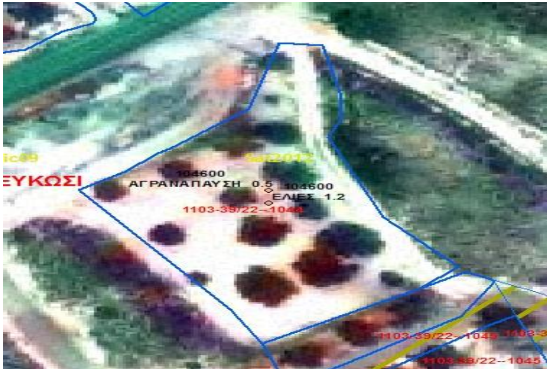
Εικόνα 2. Παράδειγμα με δέντρα που ολόκληρη η έκταση υπολογίζεται ως μόνιμη καλλιέργεια (17 δέντρα – ΜΕΕ =1.6 Δεκάρια)

Σε περίπτωση που μια έκταση θεωρηθεί σύμφωνα με τα πιο πάνω σαν « αρόσιμη γη με διάσπαρτα επιλέξιμα δέντρα » τότε θα πρέπει να δηλώνεται ως αρόσιμη γη (δηλώνοντας την καλλιέργεια που υπάρχει στο αγροτεμάχιο) δηλώνοντας επίσης και τον αριθμό και το είδος των δέντρων.