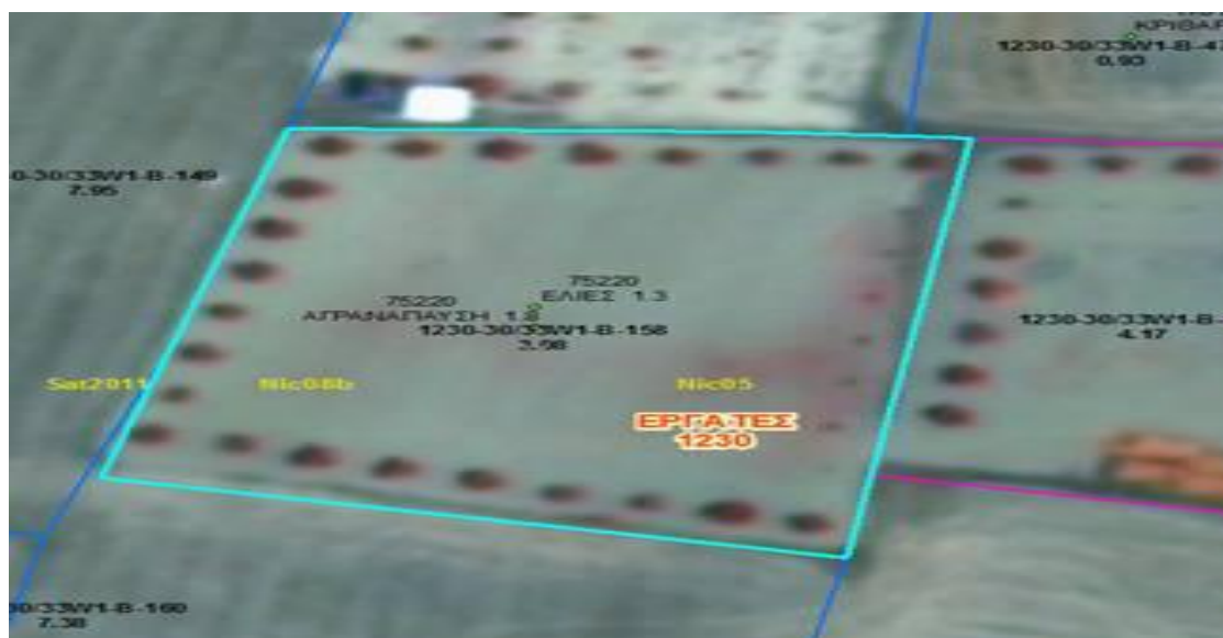
Εικόνα 4. Παράδειγμα με περίφραξη