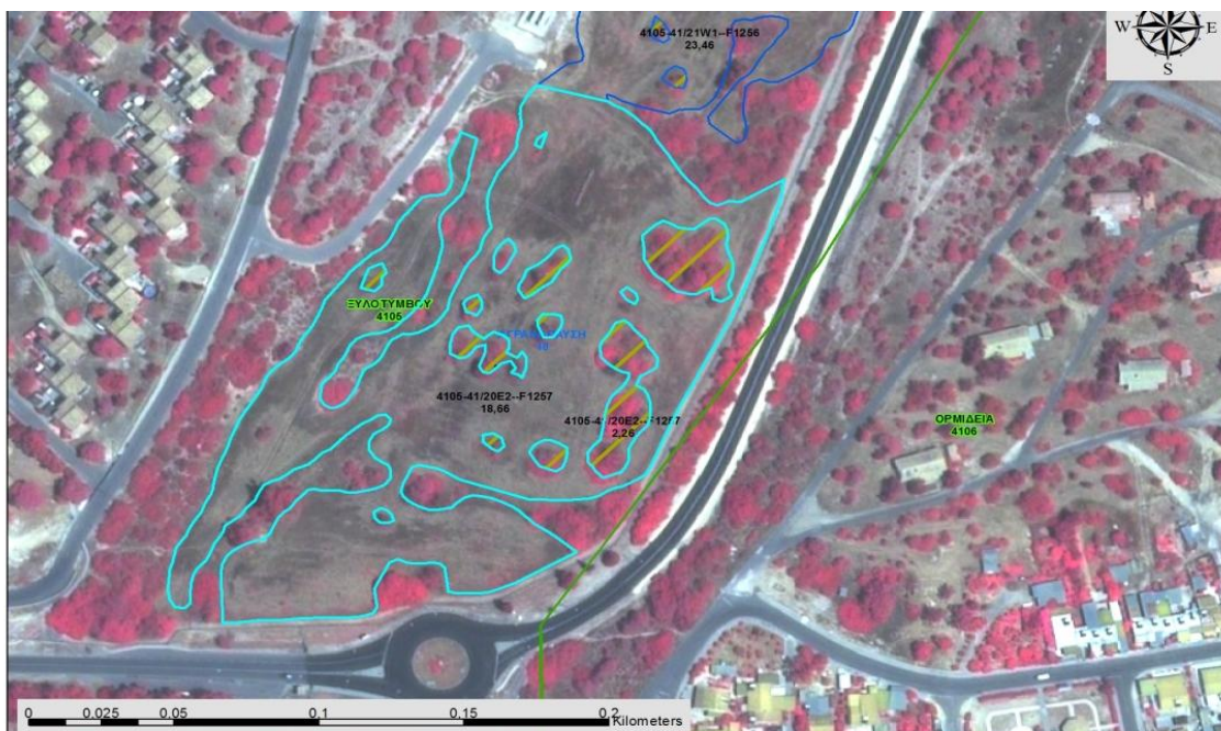
Εικόνα 3. Παράδειγμα με κομμάτι του τεμαχίου (ξεχωρίζει η αροτραία καλλιέργεια από τα δέντρα)

Στην περίπτωση που ομάδα δέντρων σε ένα τεμάχιο αναφοράς παρεμποδίζει τη γεωργική δραστηριότητα ή υπερβαίνει τα 10 δέντρα / δεκάριο, τότε η έκταση που καλύπτουν τα δέντρα αφαιρείται από την επιλέξιμη έκταση της αρόσιμης γης ή του βοσκότοπου και δημιουργείται νέο αγροτεμάχιο με τη « συμπαγή φυτεία δέντρων ». Σε τέτοια περίπτωση δηλώνεται το εν λόγω αγροτεμάχιο με τη δενδρώδη καλλιέργεια πχ. ελιές και δηλώνεται και ο αριθμός των δέντρων.