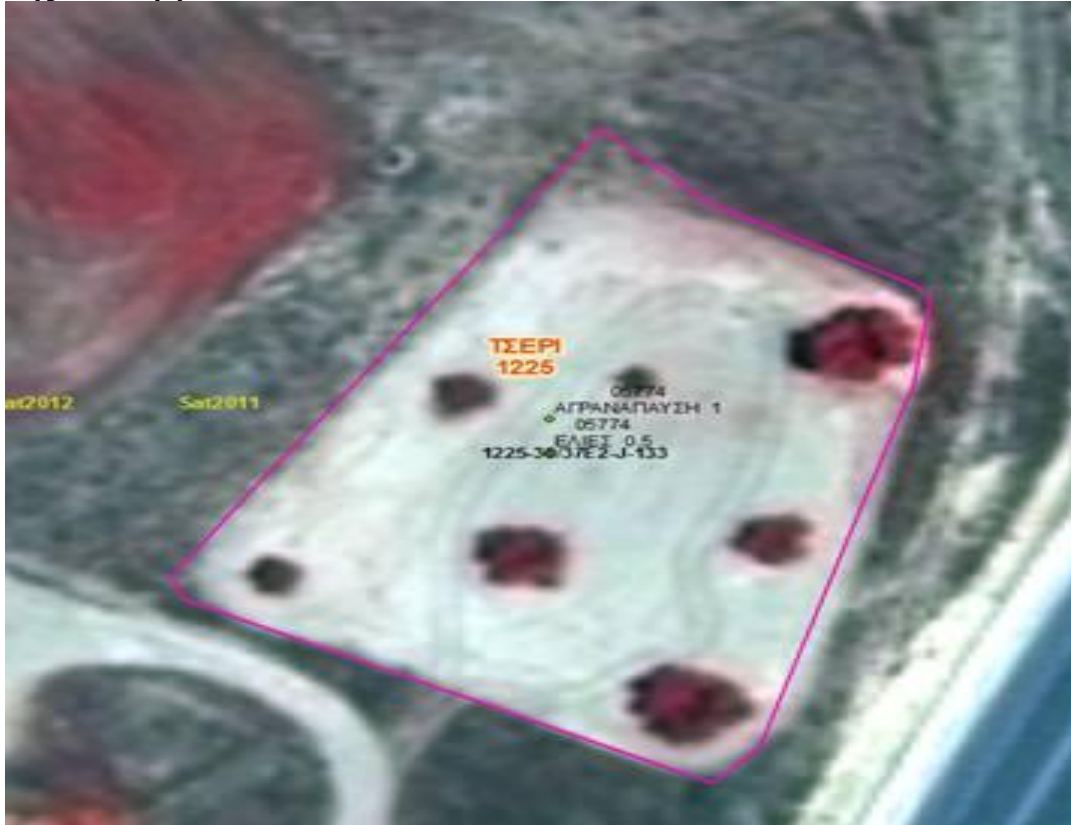
Εικόνα 1. Παράδειγμα με διάσπαρτα δέντρα που ολόκληρη η έκταση υπολογίζεται ως αρόσιμη (7 δέντρα – ΜΕΕ=1.5 Δεκάριο)

Διαφορετικά , σε περίπτωση που η πυκνότητα των δέντρων είναι μεγαλύτερη από 10 ανά δεκάριο και τα δέντρα είναι επιλέξιμα, τότε ολόκληρη η έκταση λογίζεται ως μόνιμη δενδρώδης καλλιέργεια.