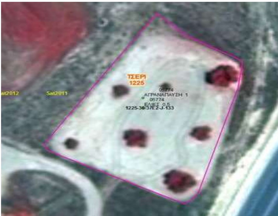
Εικόνα 1. Παράδειγμα με διάσπαρτα δέντρα που ολόκληρη η έκταση υπολογίζεται ως αρόσιμη (7 δέντρα – ΜΕΕ=1.5 Δεκάριο)